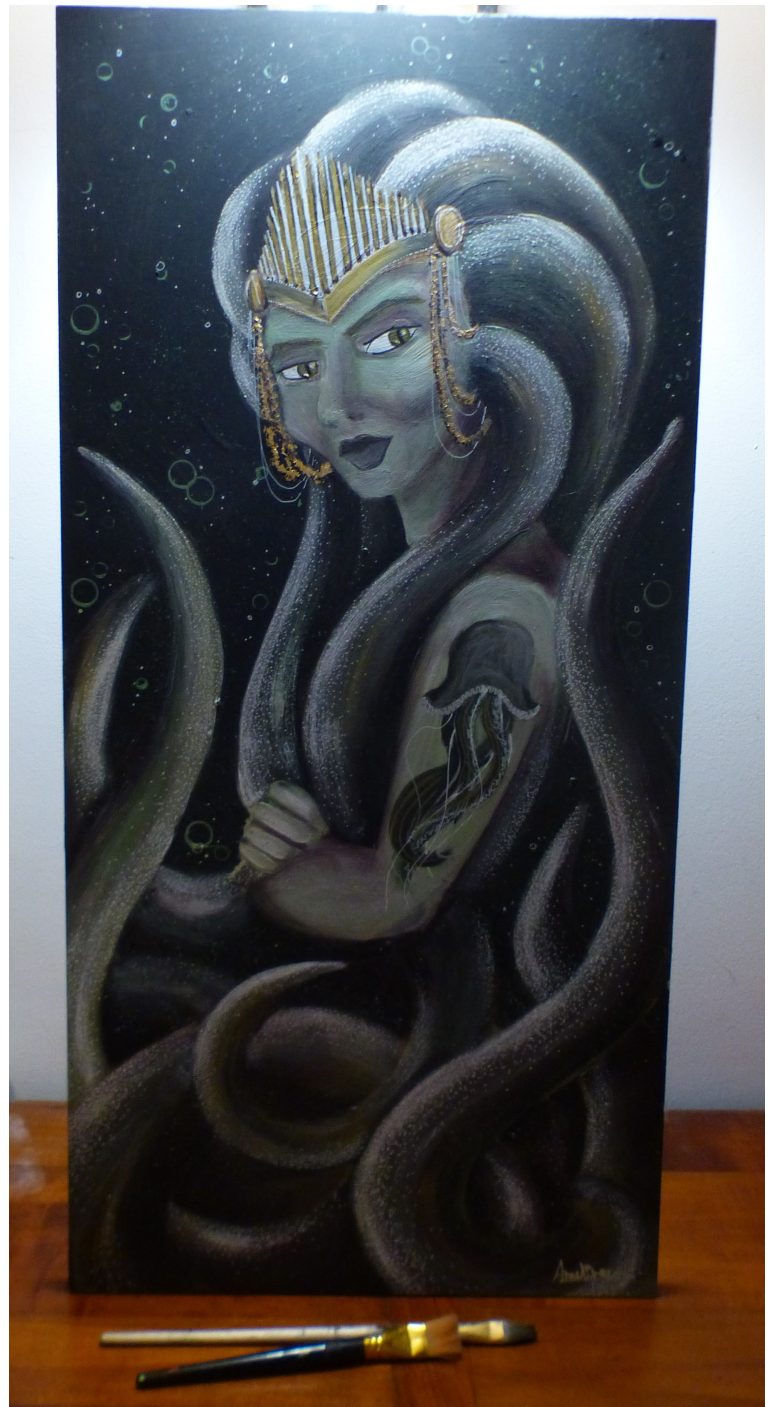
La Gribout - Peinture acrylique et encres sur bois - 39,5 x 82,2 cm - Ameline Daufresne

Le ru du Gribout continue d'exister, la vie sauvage y est mieux protégée, et certains d'entre nous ont l'espoir d'y voir réapparaître La Gribout.