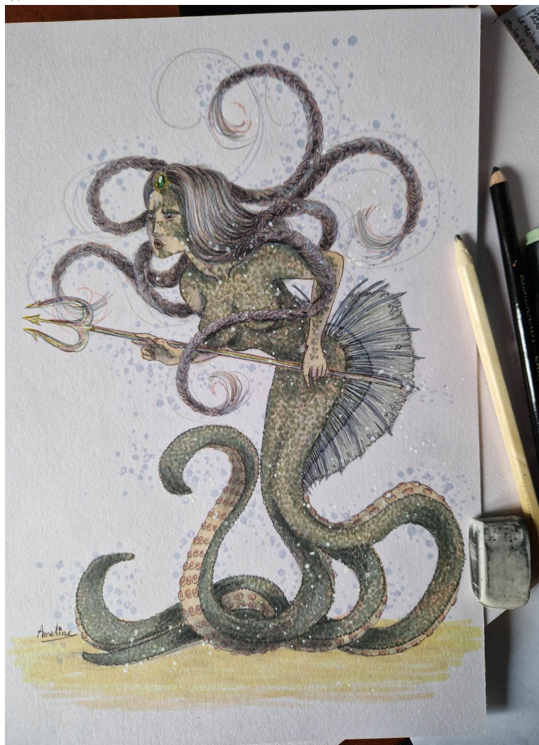
Ketel (La Caudière) - Encres sur papier - 21 x 29,7 cm - Ameline Daufresne

La Caudière, enrichie du Gribout, va se jeter dans l'Helpe Mineure, affluent de la Sambre (même racine s-av- que la Save), dont les eaux se mêlent à celles de la Meuse au lieu-dit Le Grognon.